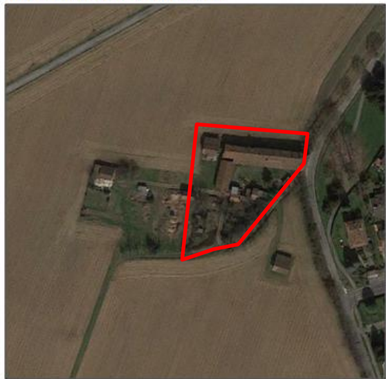
Cascina Varisco Vimercate Strada del Salaino